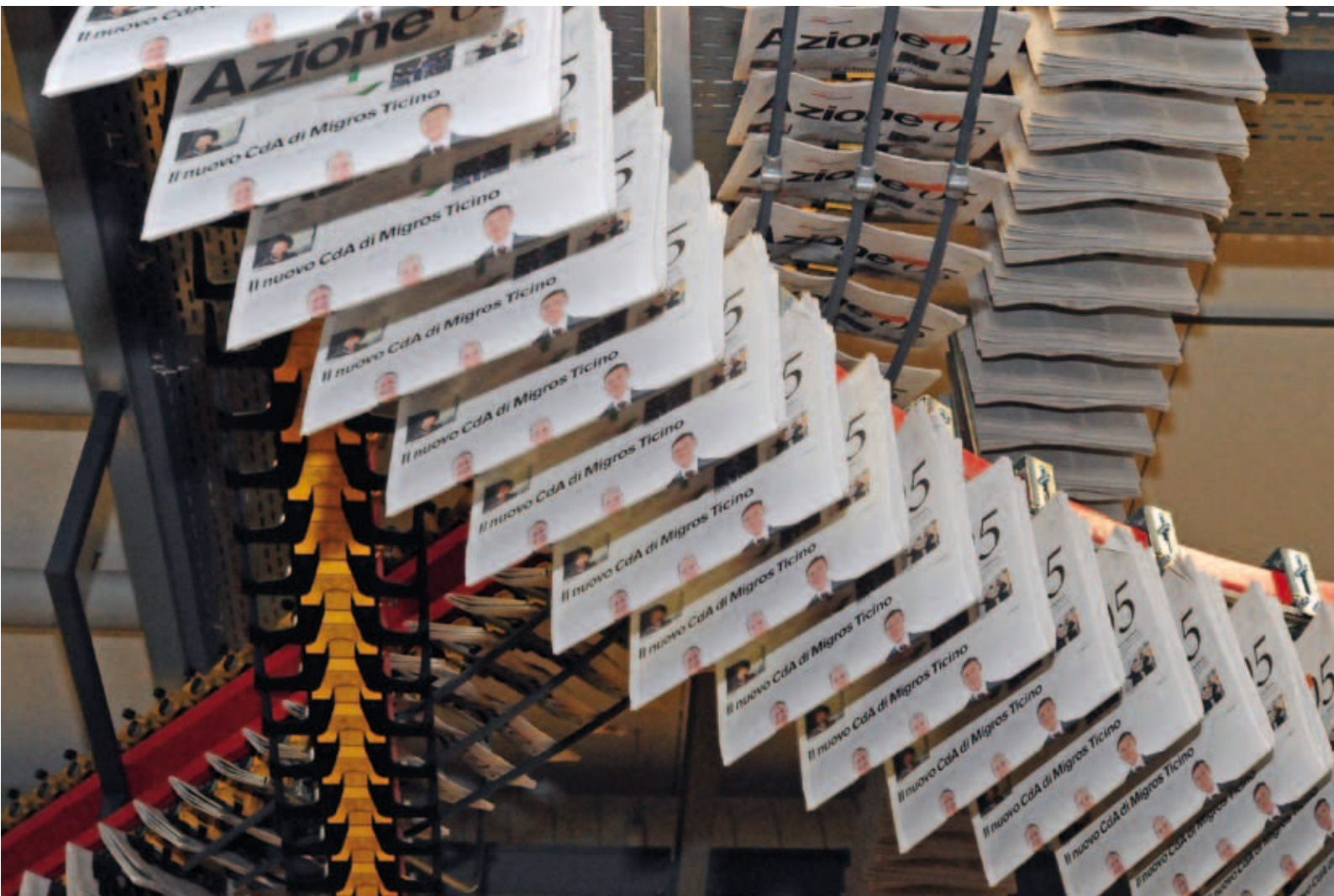
Nuova rotativa completamente a colori presso il Centro Stampa Ticino della Fondazione Corriere del Ticino.

Per il settimanale Azione , il 2010 è stato un anno di consolidamento, con qualche novità: grazie all'arrivo della nuova rotativa al Corriere del Ticino, dal 2 agosto 2010 Azione viene stampata completamente a colori, ciò che rende ancora più ariosa e accattivante la veste del giornale e rafforza l'impatto del restyling grafico introdotto il 9 novembre 2009, che ha fortemente modificato l'aspetto esteriore dell'organo ufficiale della Cooperativa Migros Ticino. E che la nuova veste grafica sia piaciuta ai lettori lo rimarca un'approfondita inchiesta commissionata in autunno all'istituto di analisi dei media D&S, con sede a Zurigo: oltre all'apprezzamento complessivo per il giornale e per i suoi contenuti, gli intervistati hanno formulato giudizi particolarmente positivi sulla nuova impostazione grafica.