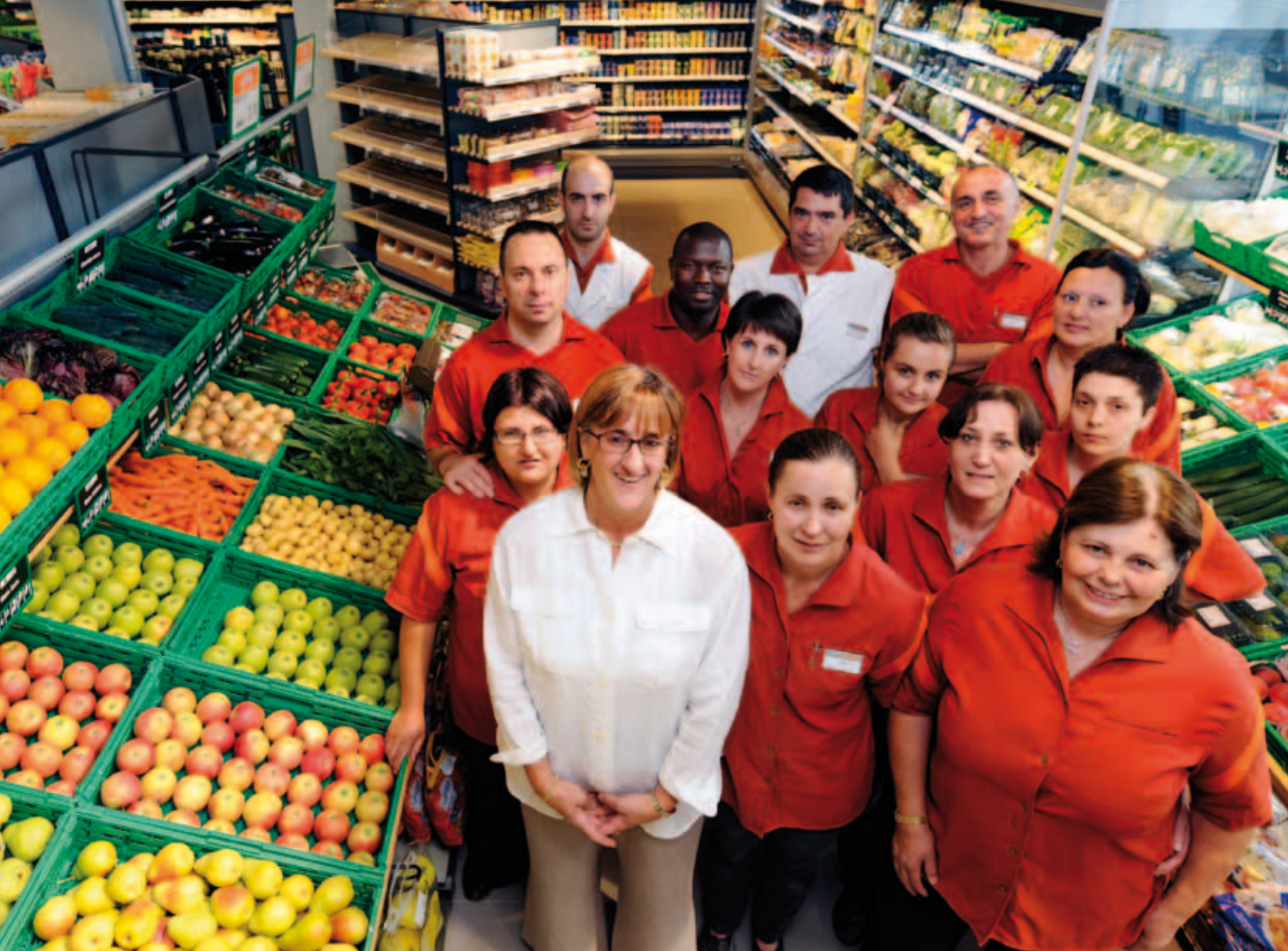
Sopra: i collaboratori nella nuova filiale di Tesserete, il giorno dell'inaugurazione. A sinistra: alcune delle novità de «I Nostrani del Ticino».